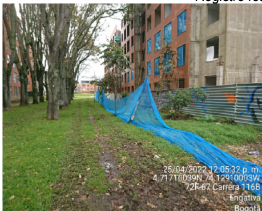
Registro fotográfico del 25/04/2022

Es importante mencionar que, se revisó el sistema FOREST de esta entidad, para determinar si CUSEZAR S.A. CUSEZAR radicó algún oficio o informe, donde se evidencie la subsanación de los requerimientos descritos en el informe técnico 01956 de 16/05/2022; este documento no fue encontrado, por lo tanto, se incumplieron los plazos de respuesta impuestos por esta subdirección.